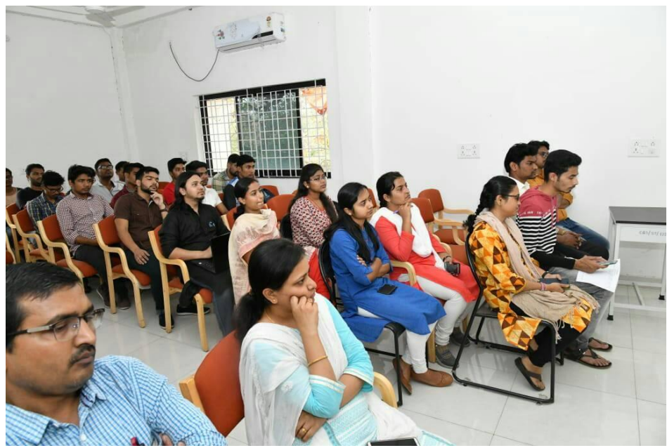
Date 12/03/2019: Debate Competition @ Center For Basic Sciences, PRSU Raipur