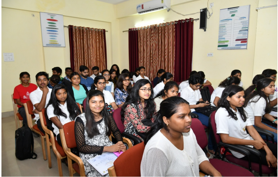
Date 18/03/2019: Valedictory & Prize Distribution @ HRDC Seminar Hall, PRSU Raipur