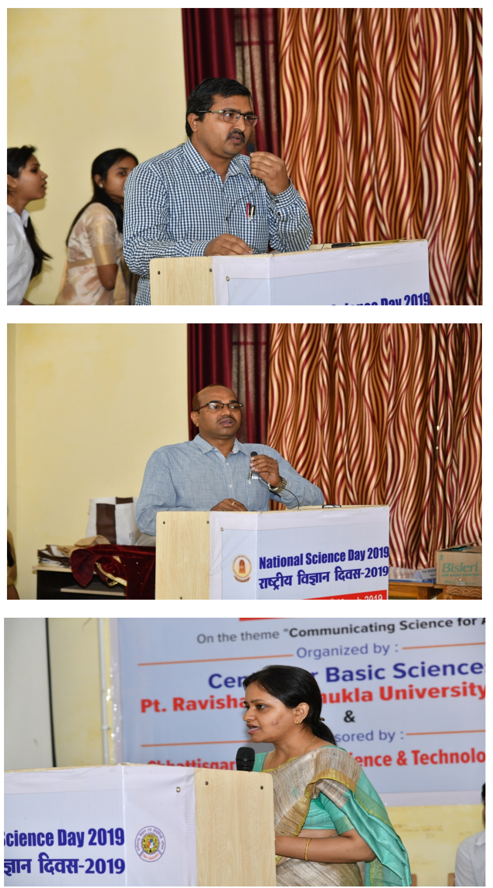
Date 18/03/2019: Valedictory Function @ HRDC Seminar Hall, PRSU Raipur