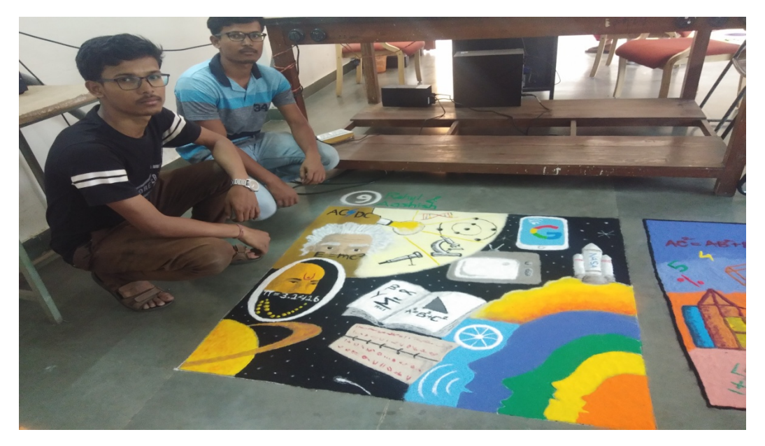
Date 18/03/2019: Rangoli Competition @ Center For Basic Sciences, PRSU Raipur