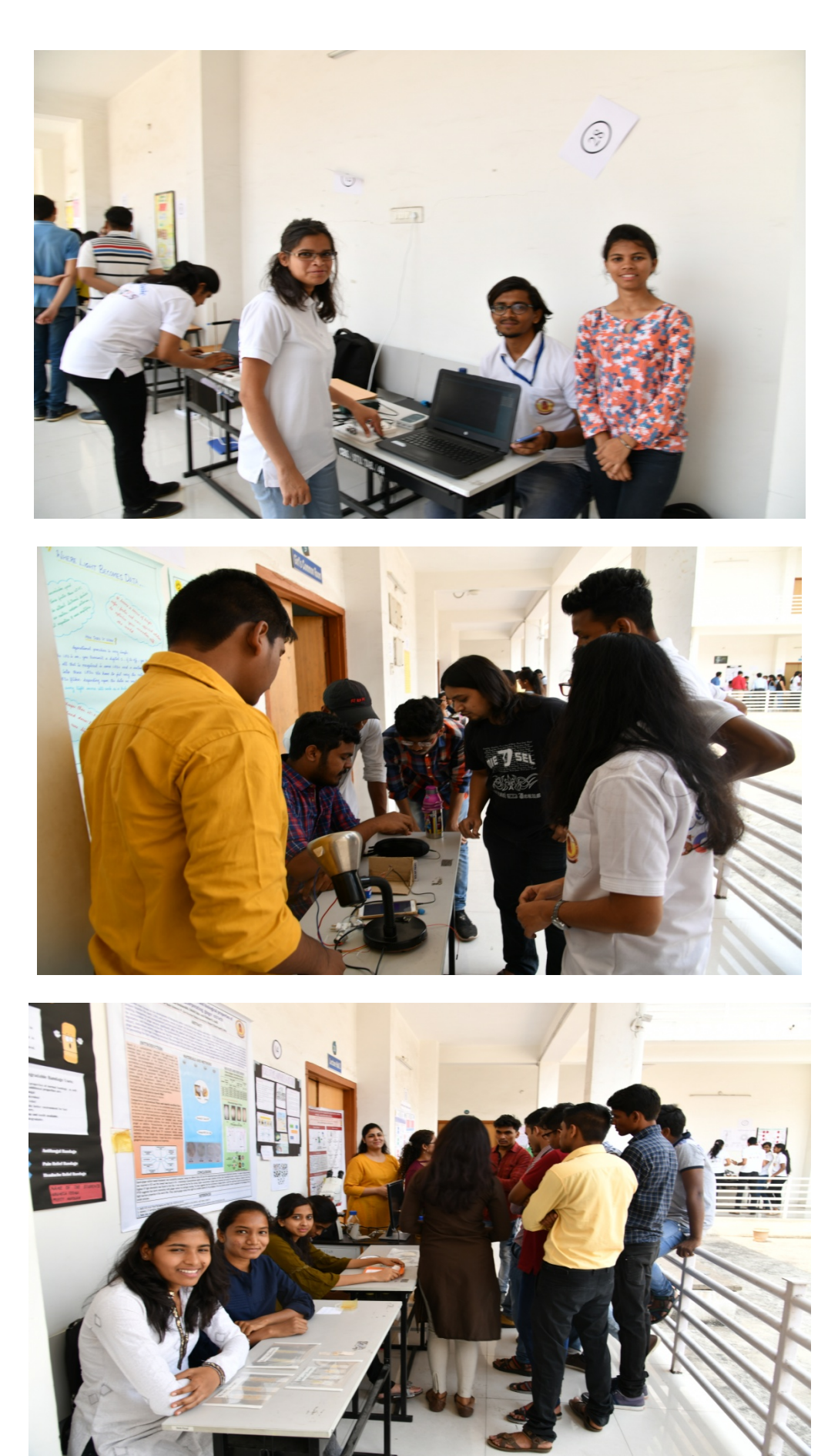
Date 18/03/2019: Model Making Competition @ Center For Basic Sciences, PRSU Raipur